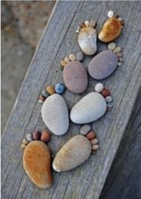
Imagen: Andrés Borbón